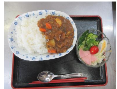
7/18 料理教室 (夏カレー、サラダ)