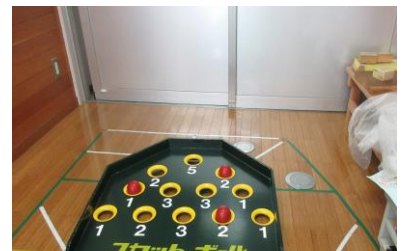
7/14 レクリエーション (スカットボール)